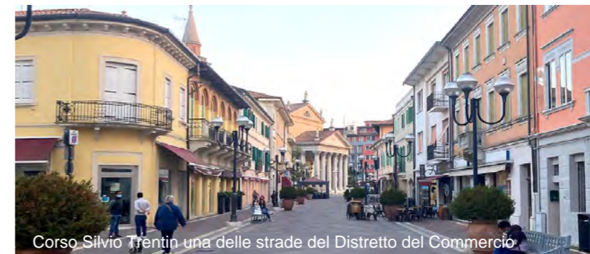
Corso Silvio Trentin una delle strade del Distretto del Commercio