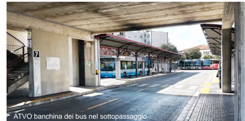
ATVO banchina dei bus nel sottopassaggio