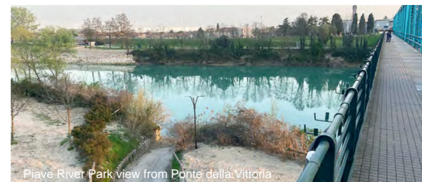
Piave River Park, view from Ponte della Vittoria