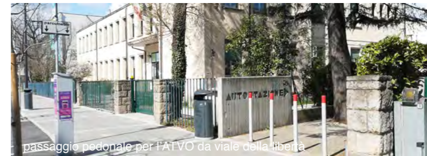
passaggio pedonale per l'ATVO da viale della libertà