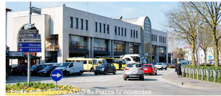
fronte della stazione ATVO su Piazza IV novembre